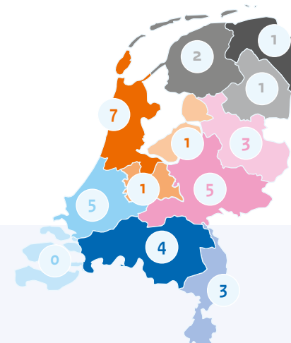
Landkaart (spreiding aanvragers) plus een deel Caribisch Nederland